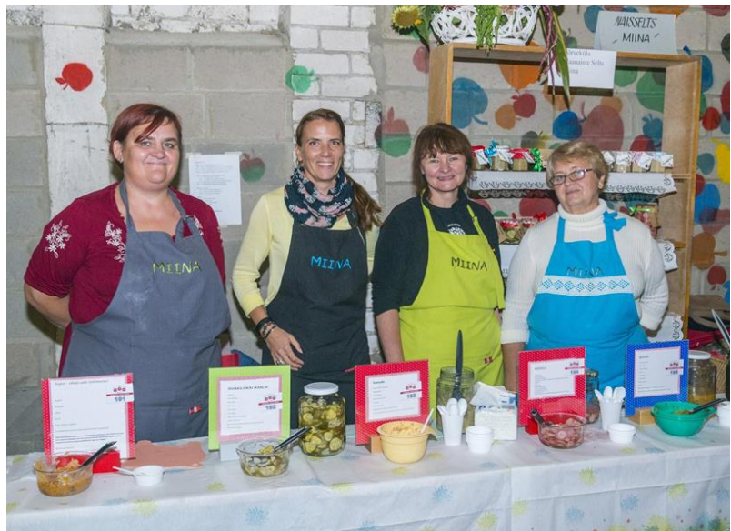
Olustvere hoidiste mess

võrgustikega ka külaliikumine Kodukant. Hoidiste messi ja kohaliku toidu laada juurde kuulub ka mitmekesine kultuurikava, avatud on kohvikud ja Olustvere mõisa tegevuskojad ning osaleda saab harivates töötubades ja meelelahutuslikes tegevustes. Samal ajal peetakse Olustveres ka rahvusvahelisi künnivõistlusi.