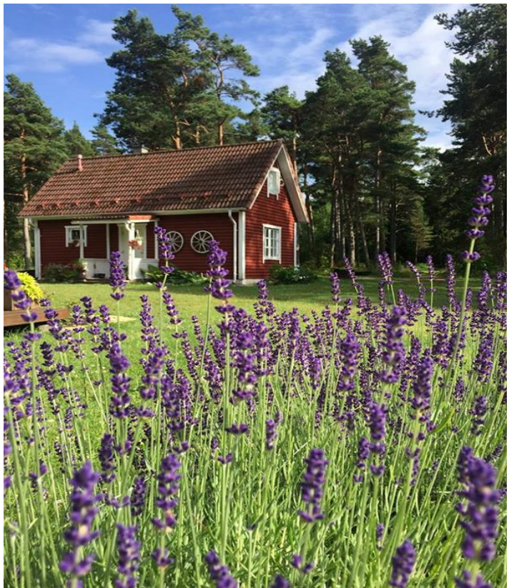
Villa Hanson puhkemaja

Sellise turismi kirjeldamiseks, mis vähendab negatiivseid ja suurendab positiivseid mõjusid, kasutatakse väljendit eetilise turism. 1. oktoobril 1999.a. on Maailma Turismiorganisatsiooni (WTO) Peaassamblee 13. istungjärgul Santiagos vastu võetud Ülemaailmne turismieetika koodeks, milles käsitletakse turismi kui tasakaalustatud arengu tegurit. Selles märgitakse, et turismi tuleb arendada keskkonnahoidlikult, et tänasega võrdsed võimalused jääksid ka tulevastele põlvkondadele. Soodustada tuleb turismisuundi, mis säästavad loodusressursse,